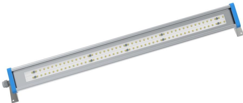
Рис. 1. Внешний вид светильника.