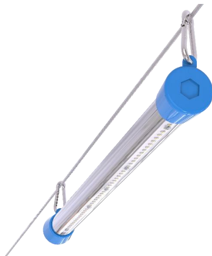
Рис.2. Крепление светильника на трос при помощи карабина.